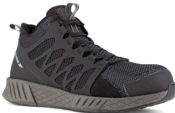
RBMX453 SPEED TR WORK ANTIESTÁTICO TALLAS / 22-27 MEX