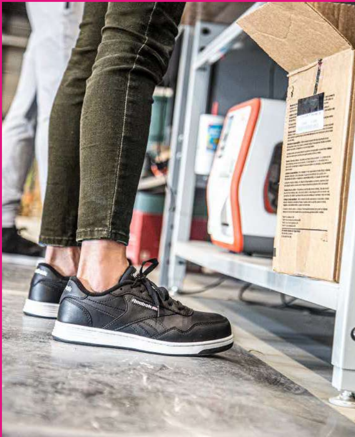
RBMX157 CLUB MENT WORK TALLAS / 22-27 MEX